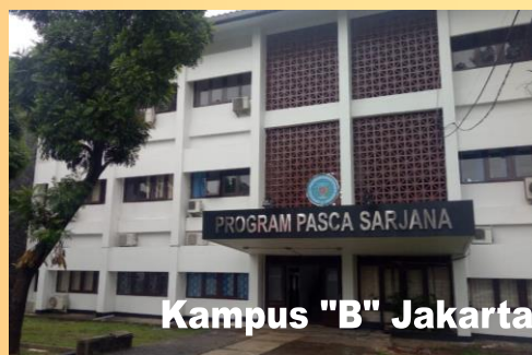
Kampus "B" Jakarta